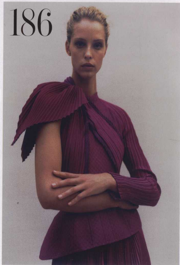
En la imagen, vestido plisado en satén de seda y organza, de Givenchy Haute Couture.