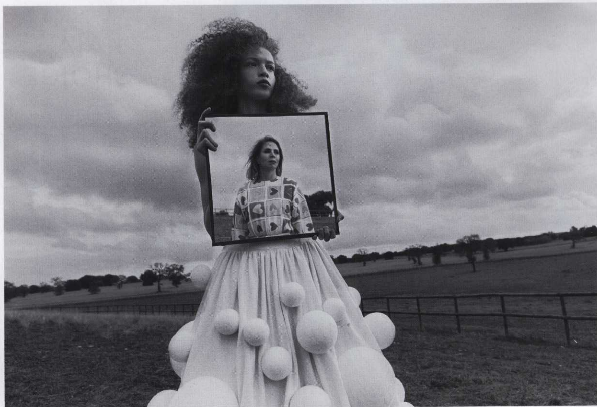
Tianna lleva vestido de novia de 2007, de AGATHA RUIZ DE LA PRADA. Ágatha (en la imagen que lleva la modelo) luce vestido de la colección retrospectiva Estampados Agatha, de o/i 2014-15, de AGATHA RUIZ DE LA PRADA. Pág. 174.