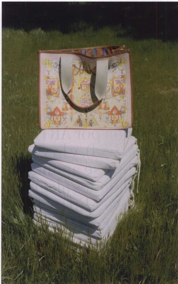
Bolso shopping con estampado ornamental de estilo retro y embellecido con detalles de piel, de ETRO. Pág. 45.