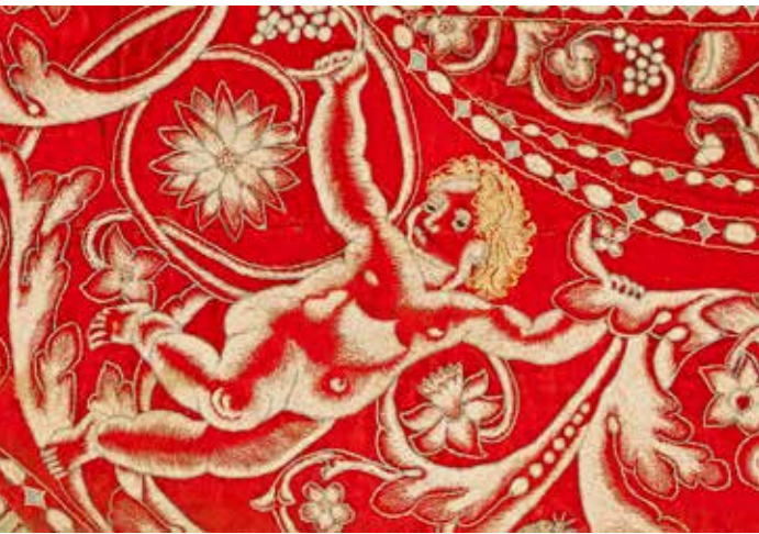
Detall de frontal d'altar. Museu Tèxtil n.r.10416