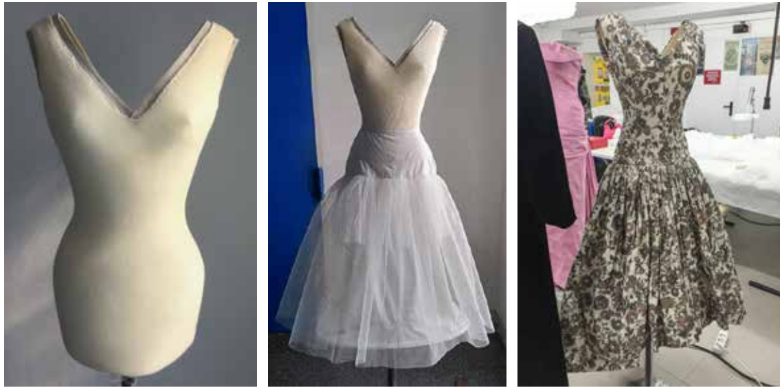
Vestit de còctel de flors del dissenyador Cristóbal Balenciaga (propietat d'Inés Carvajal)