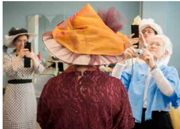
Alumnes del curs "Fes-te un vestit modernista".

A través de l'arxiu digital IMATEX, es posen a l'abast del públic més de 30.000 documents tèxtils de totes les èpoques i cultures: teixits, dissenys originals, mostraris, indumentària, complements i parament litúrgic i de la llar. IMATEX esdevé un suport per als professionals del disseny i de la producció tèxtil i de moda, un recurs per a la inspiració i la creació, així com una eina de consulta per a investigadors, estudiants i persones interessades en el patrimoni tèxtil.