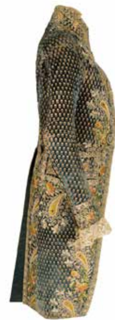
Figs. 1 i 2: Casaca masculina de vellut de seda llavorat guarnida amb brodats de sedes policromes i aplicacions de tul. Detall de la carterera d'una de les butxaques, 1775-1790. Museu Tèxtil, n.r.7232.