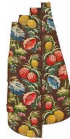
Fig. 1: Meitat del davant i meitat del darrera d'una casulla unides en una sola peça pel col·leccionista. Teixit llavorat. Seda. França. Meitat del segle XVIII. Museu Tèxtil n.r.16448-1 i 16448-2