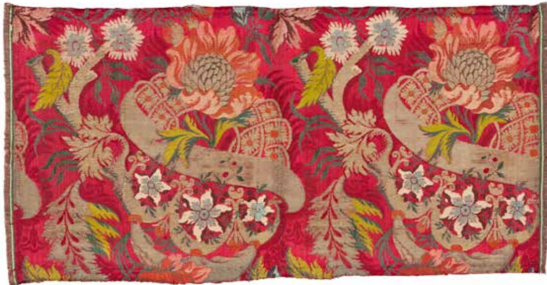
Seda d'estil bizarre Europa, 1690 - 1720 Seda, fil metàl·lic entorxat arissat ( fil riant ), fil xenilla Teixit llavorat, trama de fons que crea bastes de decoració ( liseré ), trames espolinades, ordit à liage repris 27,5 x 55 cm