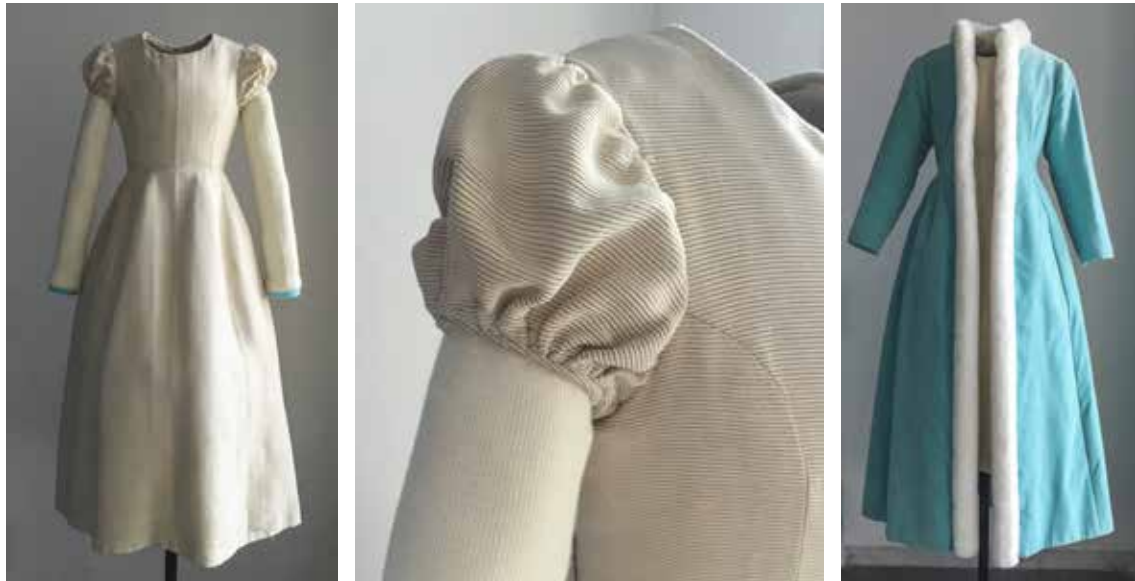
Conjunt format per dues peces (vestit i abric) Aquest conjunt és el vestit de patge del casament de la reina Fabiola de Bèlgica (1960) del dissenyador Cristóbal Balenciaga (propietat de Blanca Escrivá de Romani Mora).