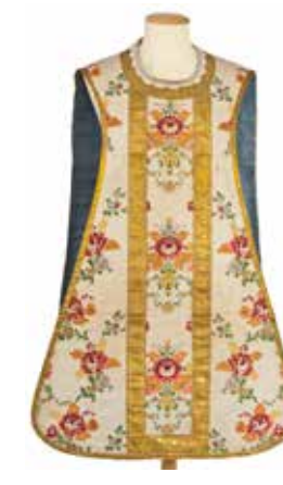
Fig. 2: Dues dalmàtiques, una casulla i una capa pluvial, formen part d'un tern litúrgic. Teixit llavorat i passameria. Seda. Espanya?, final del segle XVIII o inici del XIX. Museu Tèxtil n.r.10641, 10642, 10637, 10644