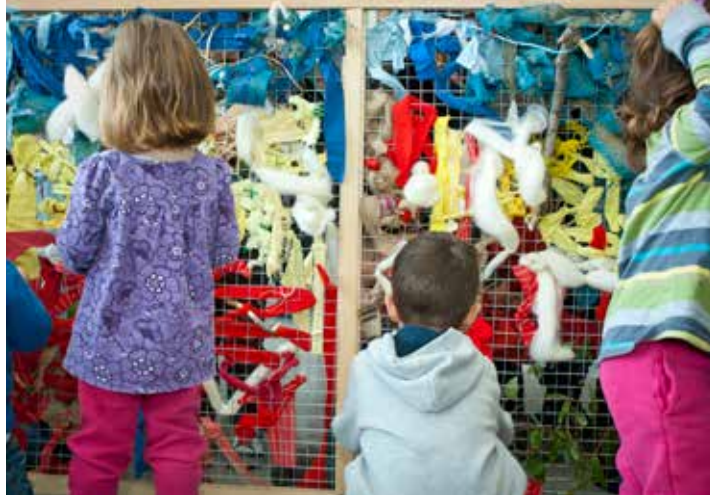
Nens i nenes que participen de les propostes familiars dels "Diumenges al Museu".