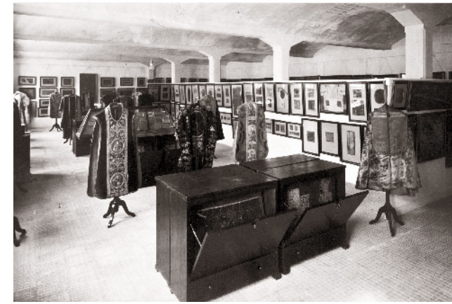
El Museo Textil Biosca, al carrer Sant Isidre de Terrassa. Autor desconegut