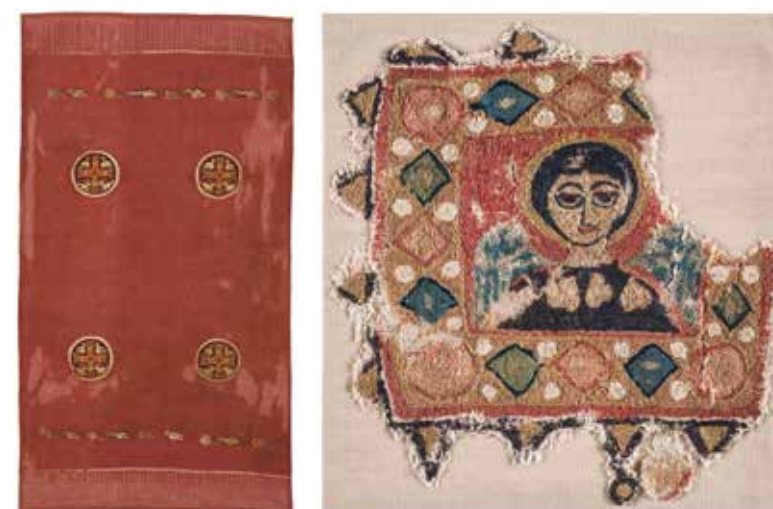
Fig. 6: Teixit de seda. Samit. Akhmin (Egipte). Segles VII-IX. Museu Tèxtil, n.r.6316

Són teixits en tafetà i tècnica de tapís, que combinen el lli i les llanes policromes per crear motius decoratius, inspirats, entre altres temes, en la mitologia grega i romana [fig. 2], elements de la simbologia cristiana, dissenys geomètrics, danses rituals o formes animals i vegetals sorgides de la fauna nilòtica. Els dissenys són en alguns casos d'un traç ingenu i d'una abstracció sorprenent. La majoria de teixits conserva la lluminositat dels colors obtinguts a partir d'elements naturals, plantes o insectes.