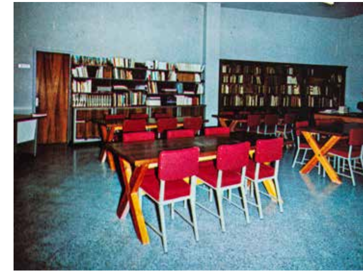
Fig. 1: Interior de la biblioteca del Museu Tèxtil, any 1972.

La biblioteca va ser una de les poques especialitzades en l'àmbit del tèxtil i la indumentària. Així, ofería una sèrie de publicacions de caràcter tècnic i professional, sobre la història del teixit, la indústria tèxtil, el tissatge, les fibres, els tints, etc., i un seguit de publicacions dedicades a la història i l'evolució de la indumentària a través dels anys, catàlegs d'exposició i guies de museus i col·leccions, entre d'altres (fig. 1).