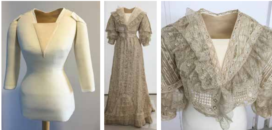
Vestit de 1900-1909, Museu Tèxtil, n.r.11927