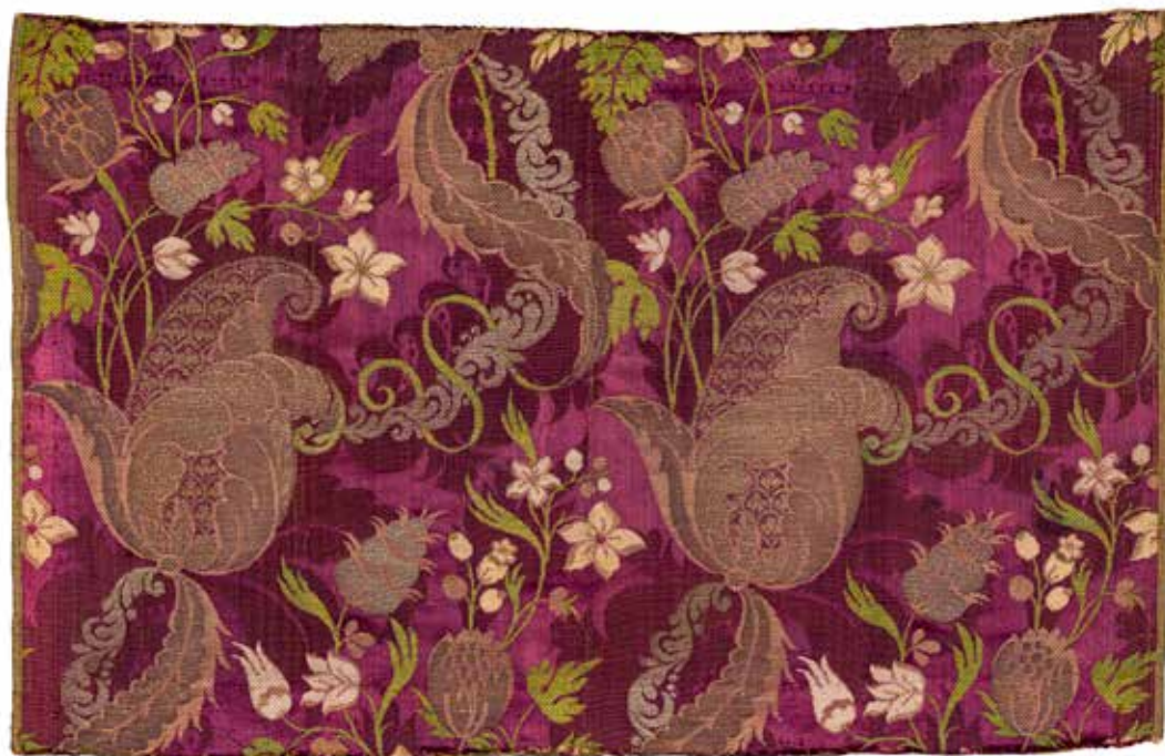
Seda d'estil bizarre Europa, 1690 - 1720 Seda, fil metàl·lic entorxat, fil metàl·lic entorxat arissat ( fil riant ) Teixit llavorat, trama de fons que crea bastes de decoració ( liseré ) i trames espolinades 35 x 55 cm