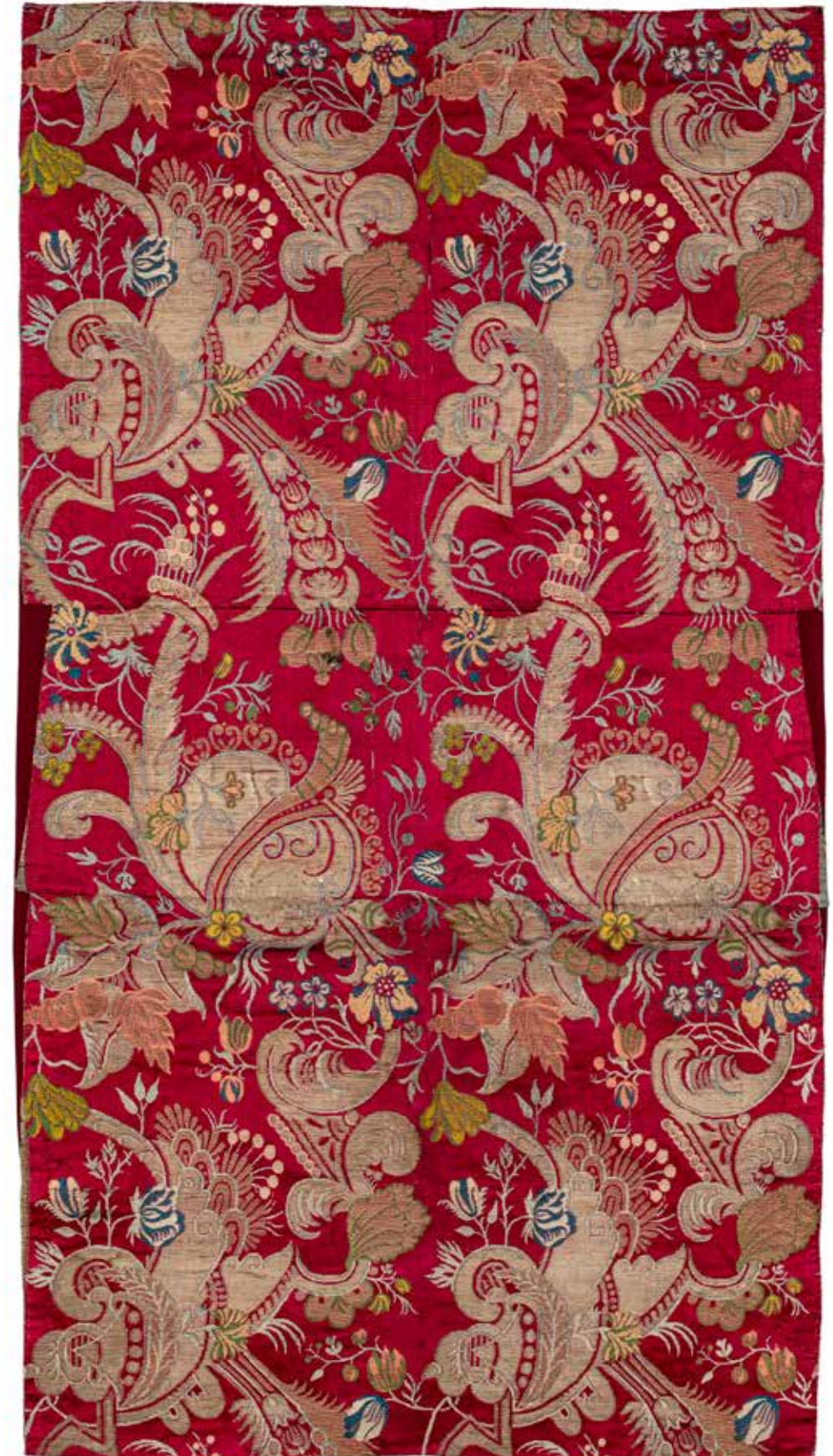
Seda d'estil bizarre Europa, 1690 - 1720 Seda, fil metàl·lic entorxat, fil metàl·lic entorxat arissat ( fil riant ) i fil xenilla Lampàs, fons setí, trames de fons que creen bastes de decoració ( liseré ) i trames espolinades 98 x 55 cm