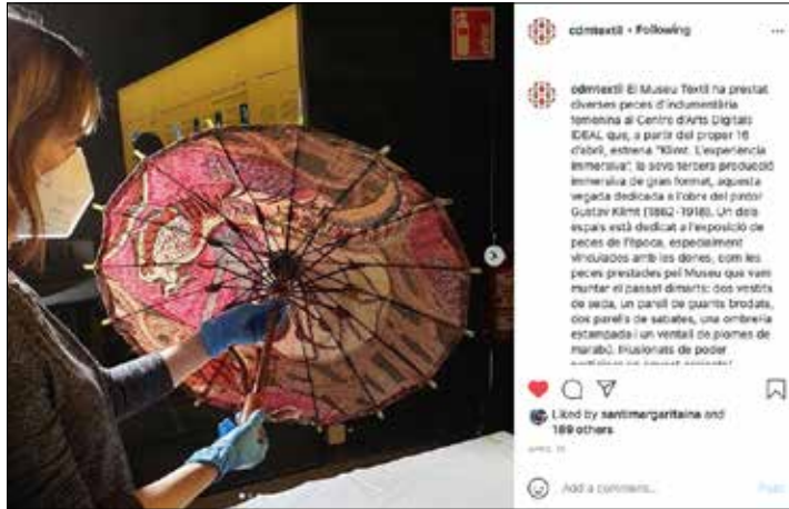
Les xarxes socials són un gran mitjà de difusió de la cultura tèxtil.

teixit creatiu. Finalment, aquelles famílies que ho desitgen s'inscriuen en una de les activitats familiars gratuïtes que el Museu ofereix cada primer diumenge de mes.