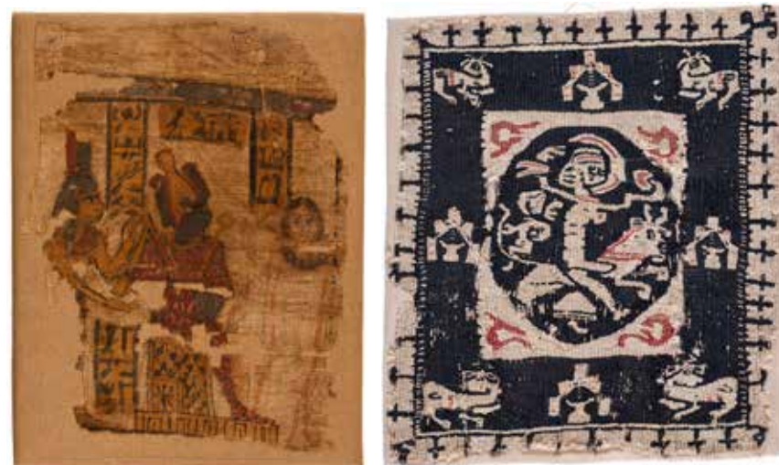
Fig. 1: Fragment de sudari amb escena pintada. Tafetà de lli. Egipte. Segle I. Museu Tèxtil, n.r.6325

Podem situar entre els segles IV i IX un altre grup de teixits amb clares influències gregues, romanes i bizantines. Coneguts de manera genèrica per les seves característiques i estil com a Teixits Coptes, avui en dia preferim esmentar-los en relació amb la seva procedència geogràfica: Teixits de la Vall del Nil. El conjunt el formen 365 peces i és la col·lecció més nombrosa conservada a l'Estat.