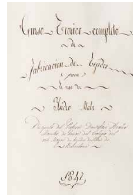
Curso teórico completo de fabricación de tejidos. Ysidro Mata. Barcelona, 1847. Col·lecció Apunts tèxtils, Biblioteca Museu Tèxtil, n.r. 9379_0063