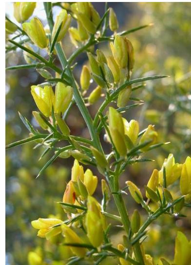
De l' argelaga s'extreuen tints naturals de tons groguencs i verdosos.