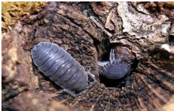
La cotxinilla es cria a Canàries per a l'elaboració de tints tèxtils de tons vermellosos.