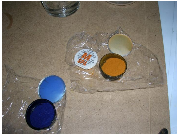
Les anilines tenen una textura de pols i són fàcils d'aplicar sobre qualsevol fibra natural o química.

Hi ha un altre tipus de colorants tèxtils que són fabricats per les persones a les indústries. Són més fàcils d'obtenir i d'aplicar sobre les matèries tèxtils. És el cas de les anilines que avui utilitzarem.